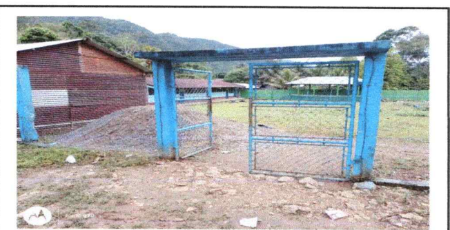
Foto 6: contruccion del porton de la entrada principal del establecimiento

Observación: Si es necesario se pueden agregar hojas adicionales y actualizar el número de hojas.