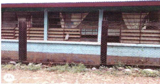
Foto 1: se Observo que la instalacion del establecimiento necesita cambio y reparacion de ventas